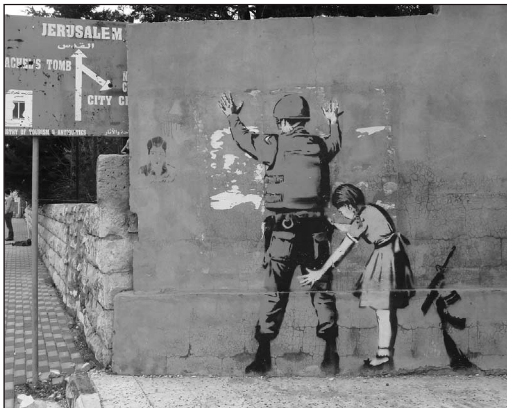
Рисунок 1. Вифлеем, Западный Берег реки Иордан, декабрь 2007 г. 9

В пользу резолюции высказались представители крупнейших экспортеров вооружений: США, Великобритании, Франции и Германии. 19 стран воздержались, среди них: Россия, Китай, Индия, Пакистан, Венесуэла. Против договора проголосовал представитель Зимбабве 8 .