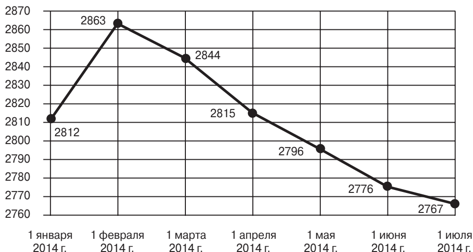
График 1. Индекс международной безопасности iSi в январе–мае 2014 г.